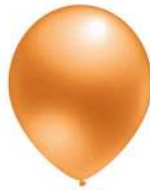
420 ORANGE (PMS 164 C)