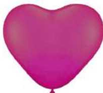
040 PINK (PMS 196 C)