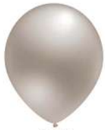
400 SILVER (PMS 421 C)