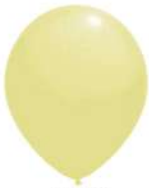
015 VANILLA (PMS 1205 C)