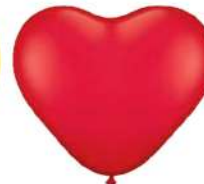
130 RED (PMS WARM RED)