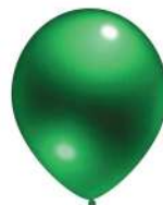
360 GREEN (PMS 356 C)