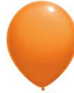
120 ORANGE (PMS 1575 C)