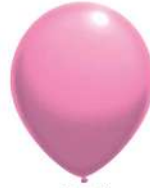
131 BRIGHT PINK (PMS 196 C)