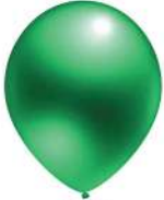
460 GREEN (PMS 355 C)