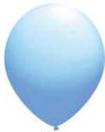
151 BRIGHT BLUE (PMS 2905 C)