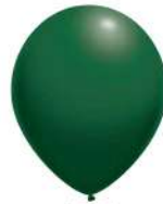
165 DARK GREEN (PMS 555 C)