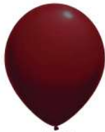
132 BURGUNDY (PMS 215 C)