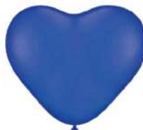
150 BLUE (PMS 2925 C)