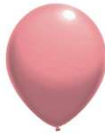
045 BABY PINK (PMS 189 C)