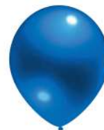
350 BLUE (PMS 308 C)