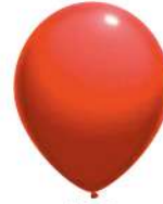
130 RED (PMS WARM RED)