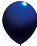
056 DARK BLUE (PMS 280 C)