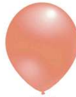
425 ROSE GOLD (PMS 1777 C)