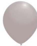
190 GRAY (PMS 434 C)