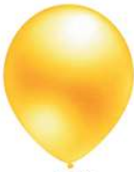
410 YELLOW (PMS 605 C)