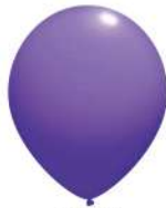
070 VIOLET (PMS 2655 C)