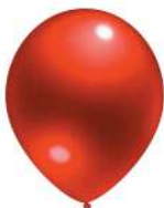
330 RED (PMS 1795 C)