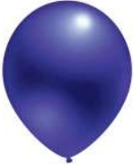
470 VIOLET (PMS 2607 C)