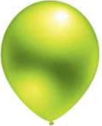
461 BRIGHT GREEN (PMS 382 C)