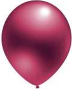
441 BURGUNDY (PMS 209 C)