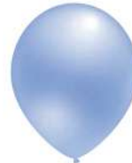
650 BLUE (PMS 290 C)