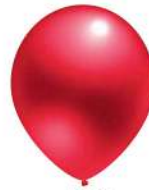
430 RED (PMS 192 C)