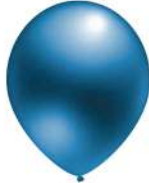
450 BLUE (PMS 3005 C)