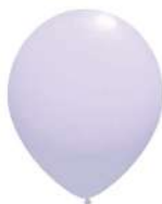
270 (60% PMS 263 C)