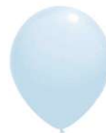
251 (30% PMS 305 C)