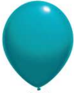
080 TURQUOISE (PMS 3125 C)