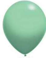
085 MINT (PMS 3252 C)