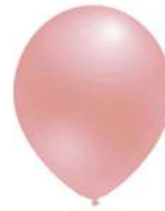
435 BRIGHT PINK (PMS 217 C)