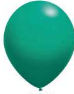
083 AQUA GREEN (PMS 326 C)