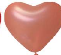
425 ROSE GOLD (PMS 1777 C)