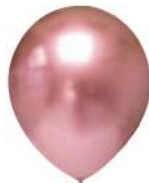
730 ROSA GOLD