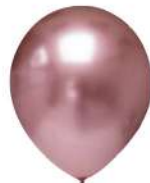
735 ROSA SILVER