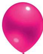
340 PINK (PMS 214 C)