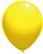
110 YELLOW (PMS 115 C)