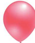
630 SALMON (PMS 1767 C)