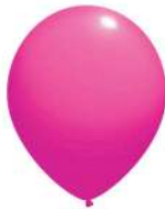
040 PINK (PMS 219 C)