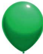
160 GREEN (PMS 354 C)