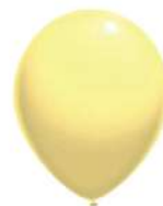
210 (40% PMS YELLOW C)