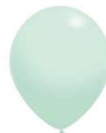
285 (40% PMS 3375 C)