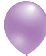
670 BRIGHT VIOLET (PMS 263 C)