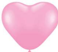
131 BRIGHT PINK (PMS 196 C)