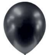
790 DARK GRAPHITE