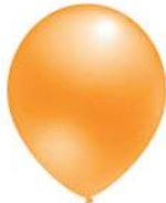
620 BRIGHT ORANGE (PMS 162 C)