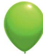
061 BRIGHT GREEN (PMS 381 C)