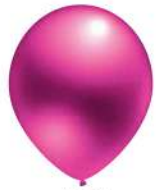
440 PINK (PMS 214 C)