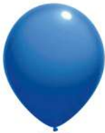
150 BLUE (PMS 2925 C)