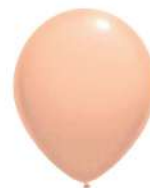
220 (30% PMS 165 C)