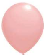
231 (30% PMS 178 C)