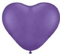
070 VIOLET (PMS 2655 C)