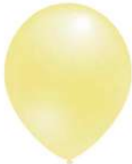
611 BRIGHT YELLOW (PMS 607 C)