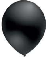
490 DARK GRAPHITE (PMS 426 C)