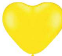
110 YELLOW (PMS 115 C)