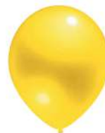
310 YELLOW (PMS 605 C)