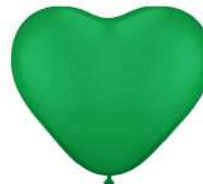
160 GREEN (PMS 354 C)