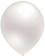
600 PEARL (50% PMS 428 C)