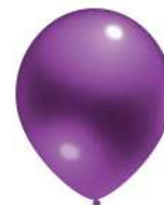
370 VIOLET (PMS 2617 C)