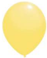
010 BRIGHT YELLOW (PMS 100 C)