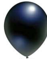
199 BLACK (PMS 426 C)