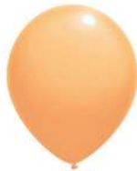
020 BRIGHT ORANGE (PMS 162 C)