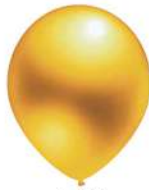
415 GOLD (PMS 110 C)