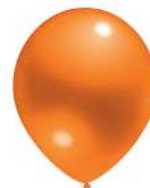
320 ORANGE (PMS 164 C)